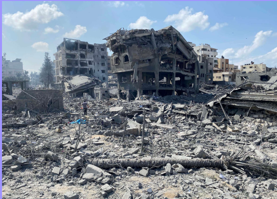
“Palestinians inspect the damage following an Israeli airstrike on the El-Remal area in Gaza City on October 9, 2023”: “Damage in Gaza Strip during the October 2023 - 32.jpg”